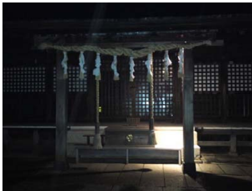
(ライトに照らされる賽銭箱。夜の参拝者も珍しくない！?)

あかりが灯っていましたが、別に閉まっているわけでは無いようだったので、ちょっと不審かな……と思いながらも入って行きました。