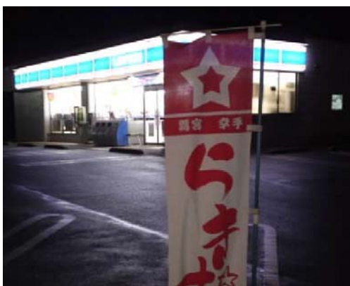
(道中で見つけた町のホットステーションに、こんなのぼりが！)

周辺をひとしきり歩きまわって、これで、少しは読み応えのあるレポートにできたかな、と駅に戻り始発を待つ。