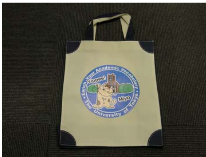
東大英単のキャラクターMIYOちゃん